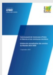
Schéma de mutualisation