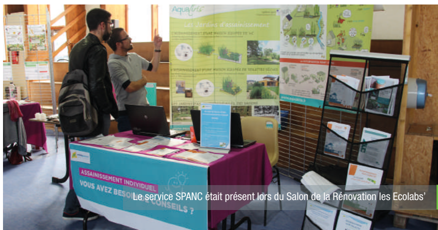
Le service SPANC était présent lors du Salon de la Rénovation les Ecolabs'

Depuis 2016, Le Service Public d'Assainissement Non Collectif (SPANC) de la communauté de communes a développé ses missions de conseil et d'information auprès des habitants. En 2018, Erdre & Gesvres, avec l'Agence de l'Eau Loire Bretagne, rentre dans une phase concrète et propose des solutions « clés en main » pour la réhabilitation des installations.