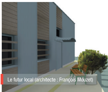
Le futur local (architecte : François Mouzet)

Depuis 20 ans la commune de Nort-sur-Erdre met à disposition une salle communale pour la distribution des repas des Restos du Cœur. Cette salle vétuste, n'est plus conforme aux normes de sécurité et d'accueil aussi bien pour les bénéficiaires que pour les bénévoles. Un nouveau local construit par la communauté de communes ouvrira à la fin de l'automne 2019.