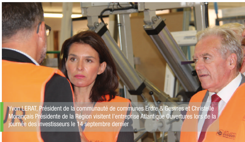
Yvon LERAT, Président de la communauté de communes Erdre & Gesvres et Christelle Morançais Présidente de la Région visitent l'entreprise Atlantique Ouvertures lors de la journée des investisseurs le 14 septembre dernier

Qu'ils soient publics ou bien privés, depuis plusieurs mois de nombreux investissements sont en cours sur la communauté de communes. Des magasins, un nouveau parc commercial, un parc tertiaire, ou encore 2 plateformes logistiques à venir ... le territoire est sans conteste attractif et convoité, et les investisseurs l'ont très bien compris.