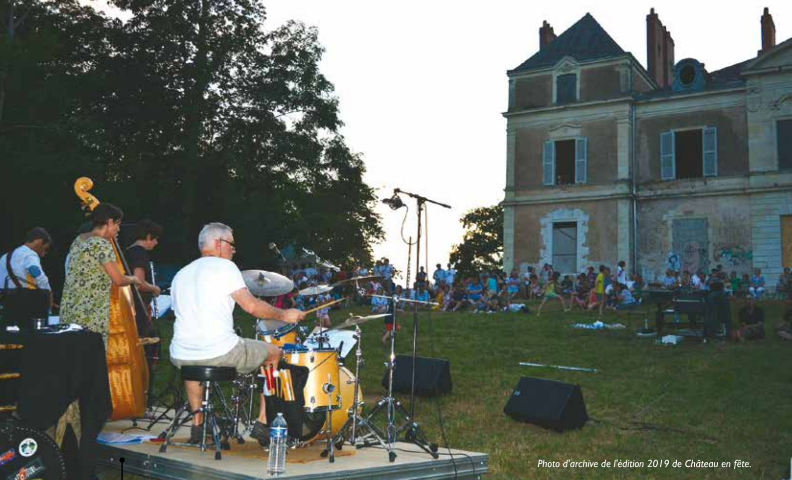
Photo d'archive de l'édition 2019 de Château en fête.