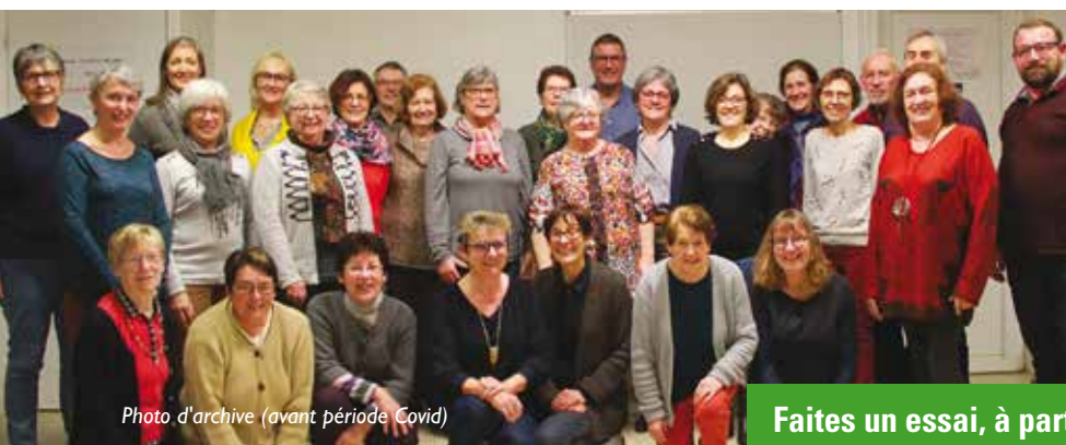
Photo d'archive (avant période Covid)