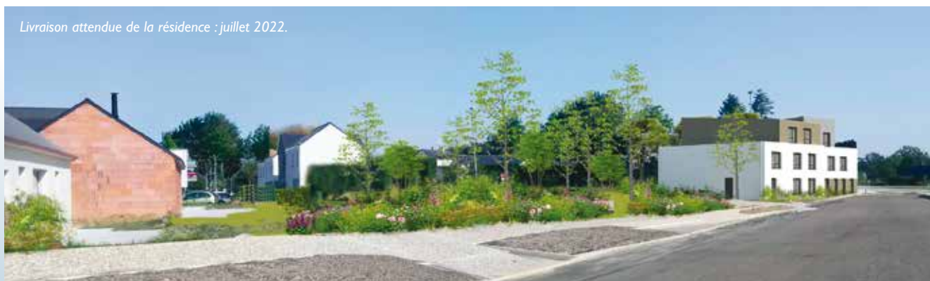
Livraison attendue de la résidence : juillet 2022.

tier, la future résidence est composée de deux étages, une toiture (double pente) en bois, recouverte d'une couverture métallique, le projet sera conçu avec des matériaux sobres (enduits blanc et brun) et nobles (zinc). De petite taille, la structure proposera 20 logements de 18 à 32 m 2 . « Caractéristique singulière de ces résidences : il s'agit d'hébergement temporaire, d'une durée de deux ans maximum, une offre agissant comme un tremplin vers un lo-