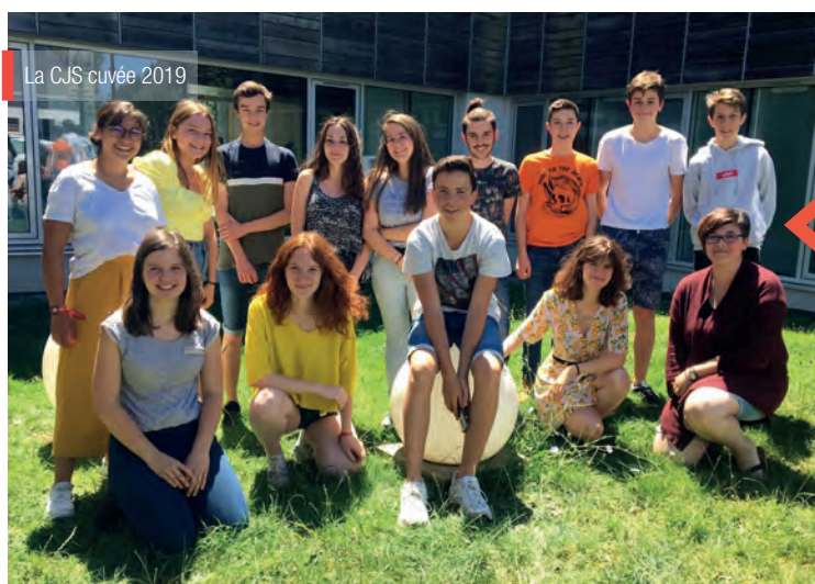
La CJS cuvée 2019