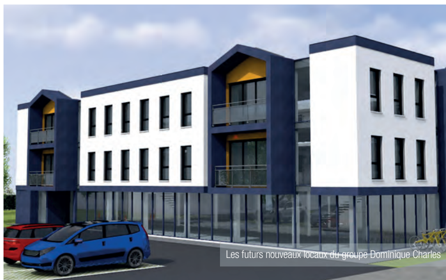
Les futurs nouveaux locaux du groupe Dominique Charles

De nouveaux bureaux, doublés de nouveaux projets puisque la société Maisons Dominique Charles construit également sur ce parc, DDland et une crèche inter-entreprises.