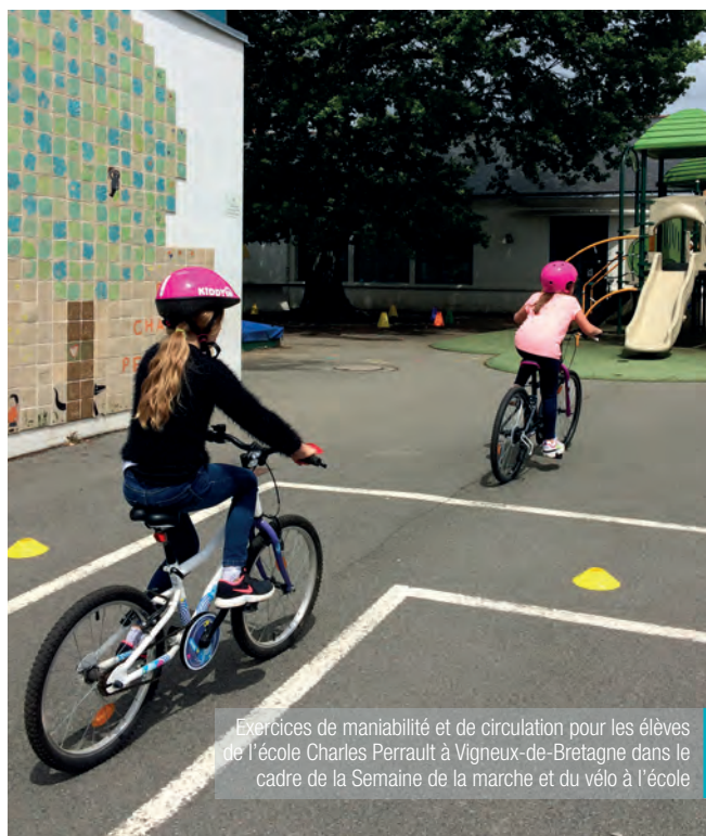
Exercices de maniabilité et de circulation pour les élèves de l'école Charles Perrault à Vigneux-de-Bretagne dans le cadre de la Semaine de la marche et du vélo à l'école

■ Erdre & Gesvres a intégré le Plan Vélo au Plan Global de Déplacement (PGD) pour faire de notre territoire, un territoire cyclable. Adopté en conseil communautaire en juin, le Plan Vélo s'est fixé un objectif ambitieux : passer d'environ 1300 déplacements à vélo par jour à environ 8000.