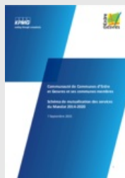
Schéma de mutualisation