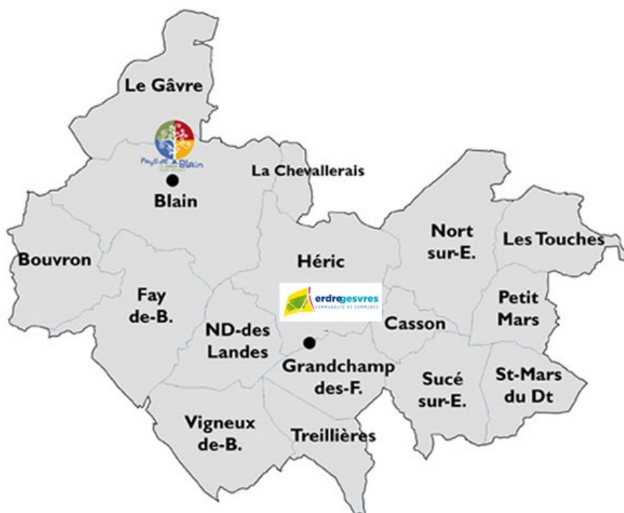
Périmètre du CLIC d'Erdre & Gesvres et du Pays de Blain

Écoute, évaluation, accompagnement individualisé, c'est dans cet esprit que les coordinatrices du CLIC accueillent près de 600 personnes en moyenne chaque année.