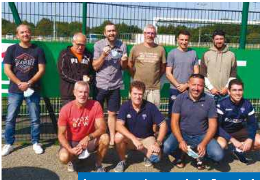
Le nouveau bureau de la Symphofoot