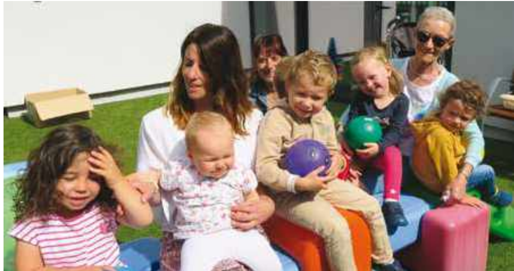
Précision : depuis la prise de vue en juillet dernier, le port du masque est à nouveau obligatoire pour les professionnels de la petite enfance.

Ils ont dû jongler entre respect des gestes barrières et maintien du contact avec les enfants. Depuis le début de la crise sanitaire, les professionnels de la petite enfance ont dû très rapidement adapter leur métier aux nouveaux protocoles sanitaires. À Treillières, les assistants maternels ont traversé une période agitée.