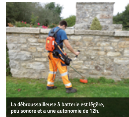
La débroussailluse à batterie est légère, peu sonore et a une autonomie de 12h.

La commune a investi 10 800 € dans ce matériel qui a été subventionné à hauteur de 70% par l'EDENN (Entente pour le Développement de L'Erdre Navigable et Naturelle).