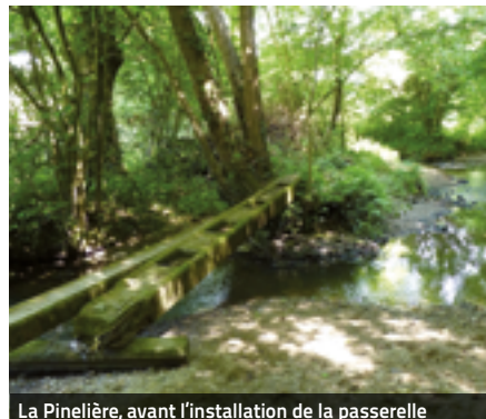
La Pinelière, avant l'installation de la passerelle

La commune vient de mettre en place quatre nouvelles passerelles sur ses chemins balisés.