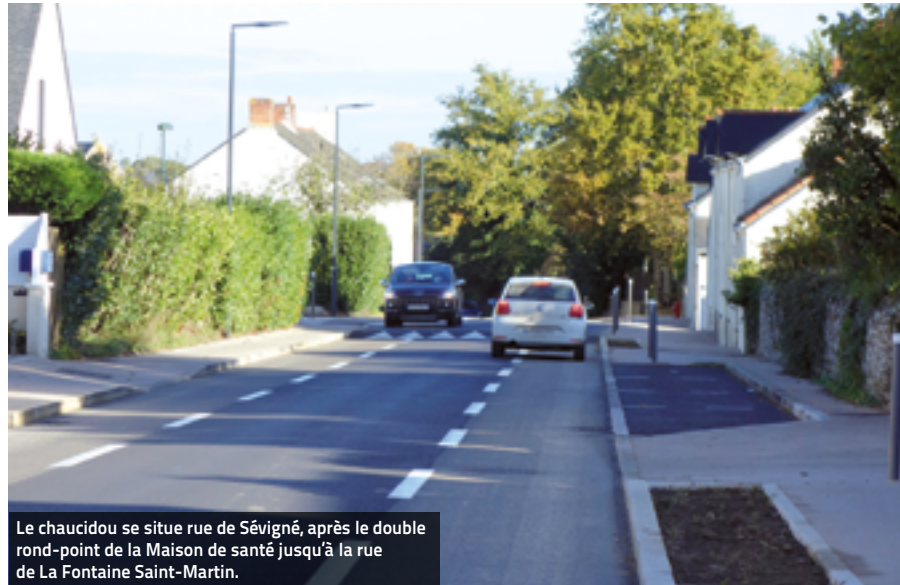
Le chaucidou se situe rue de Sévigné, après le double rond-point de la Maison de santé jusqu'à la rue de La Fontaine Saint-Martin.

À la rentrée, un "chaucidou" a été aménagé rue de Sévigné. Présentation de ce nouveau concept.