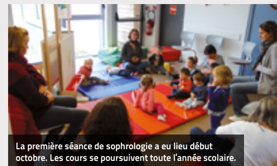
La première séance de sophrologie a eu lieu début octobre. Les cours se poursuivent toute l'année scolaire.

La compagnie La douche du Léopard propose quant à elle de l'éveil corporel autour de la lecture à la médiathèque de Fay de Bretagne. Par le mouvement, par des chansons, l'enfant sera amené à découvrir les livres, le corps et son imaginaire.