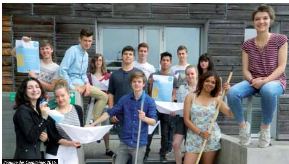
L'équipe des Coopératives 2016.

Tonte de pelouse, travaux de peinture, nettoyage ou rangement en tout genre, petit bricolage... Pour tous vos travaux, faites confiance aux jeunes de la Coopérative Jeunesse de Services. Ils sont motivés et sont prêts à répondre à toutes vos demandes !