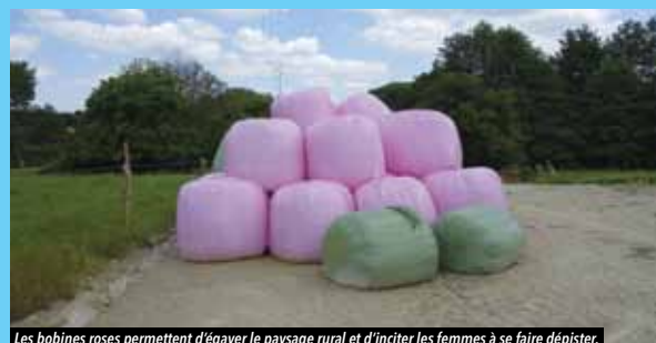
Les bobines roses permettent d'égayer le paysage rural et d'inciter les femmes à se faire dépister.

O n peut apercevoir depuis peu quelques touches de rose dans les champs de la commune. Il s'agit de balles de foin enrubannées de plastique rose, symbole du combat contre le cancer du sein.