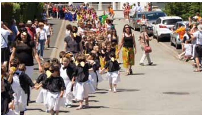
10 juin. Sur le thème du monde, les enfants de l'école Sainte Anne ont défilé dans la rue à l'occasion de la kermesse de l'école.