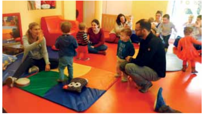
20 mai. Le multi-accueil et le Relais Assistantes Maternelles organisaient une première matinée parents-enfants autour de la musique et du jeu.