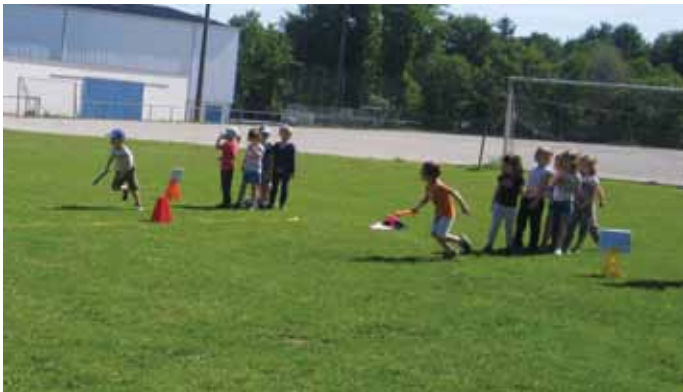
23 mai. Les classes de moyenne et grande section de Saint-Exupéry ont accueilli une classe de Fay de Bretagne dans le cadre d'une rencontre USEP athlétisme.