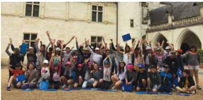
22 et 23 mai. Les élèves des classes de CM1 et CM2 de l'école Charles Perrault ont participé à un séjour patrimoine à Villandry. L'occasion pour eux de développer les compétences en lien avec les programmes scolaires en découvrant le patrimoine du Val de Loire et ses châteaux.