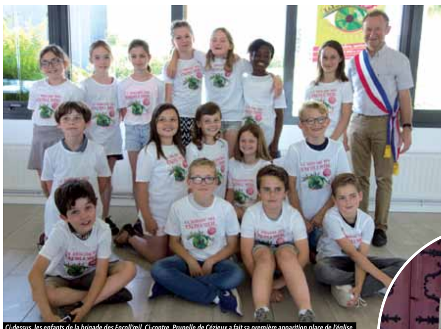
Ci-dessus, les enfants de la brigade des Encoll'œil. Ci-contre, Prunelle de Cézieux a fait sa première apparition place de l'église.

Prunelle de Cézieux, la mascotte du festival portée disparue depuis un mois a été repérée pour la première fois sur la commune le 9 juin. La Brigade des Encoll'œil a une mission importante : la guider vers l'Écomusée avant le 2 juillet, jour du festival Y'a pas d'âge.