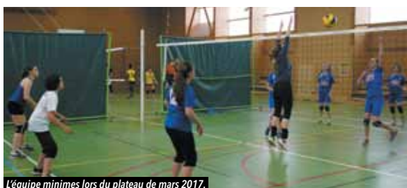
L'équipe minimes lors du plateau de mars 2017.

Le club ouvre ses portes les mardis soirs à ceux qui souhaitent découvrir la discipline.