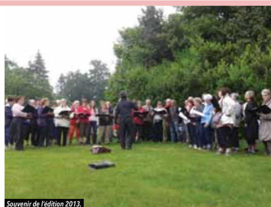
Souvenir de l'édition 2013.

À l'issue de la première randonnée, nous donnerons un concert à l'église, puis une autre petite escapade nous mènera à l'Écomusée Rural du Pays Nantais pour un second concert forcément convivial à l'heure de l'apéritif. Le troisième et dernier concert aura probablement lieu dans le parc du Bois-Rignoux, tout comme le goûter final.