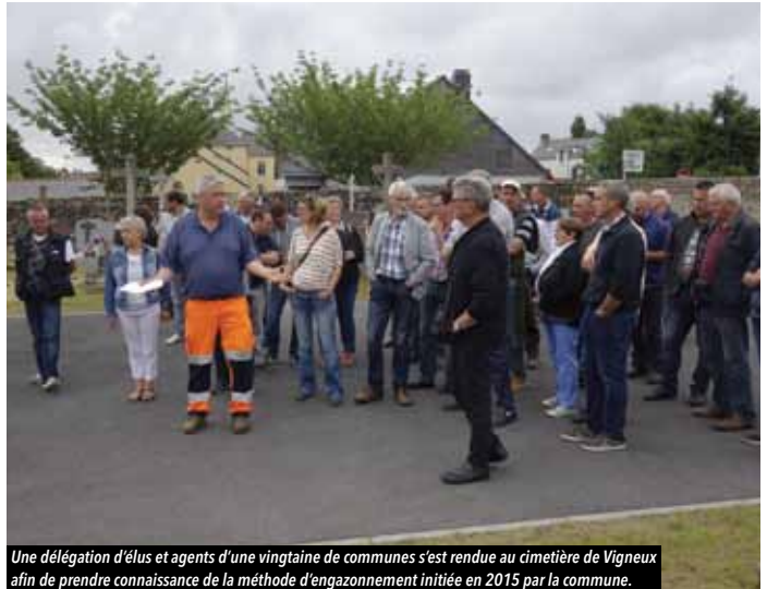
Une délégation d'élus et agents d'une vingtaine de communes s'est rendue au cimetière de Vigneux afin de prendre connaissance de la méthode d'engazonnement initiée en 2015 par la commune.

D epuis quelques années, la commune s'est engagée dans une démarche écologique de réduction d'usage des pesticides appelé « zéro phyto ». Progressivement, les cimetières ont été engazonnés, du matériel a été acheté pour entretenir les grands espaces tels que les terrains de sport, les herbes ont petit à petit retrouvé leur place de