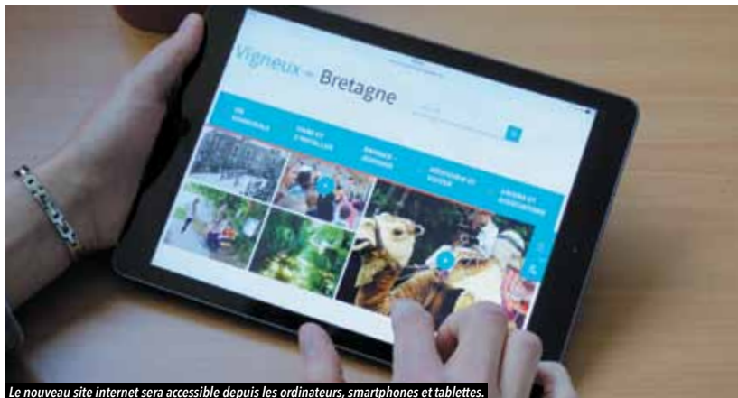
Le nouveau site internet sera accessible depuis les ordinateurs, smartphones et tablettes.

La commune lance son nouveau site internet cet été. Les Vignolais pourront le consulter depuis leur mobile et tablette, et y trouver de nombreuses actualités et démarches en ligne.