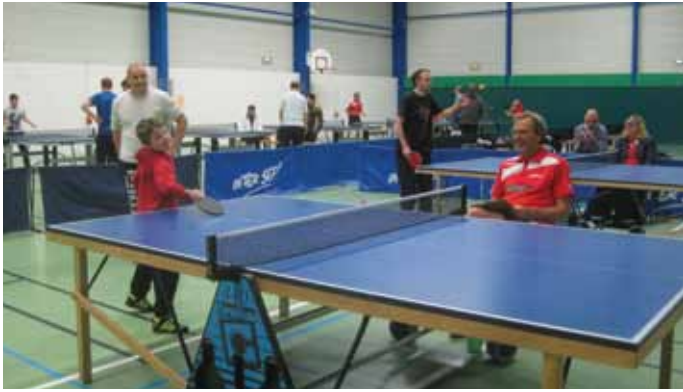
28 avril et 19 mai. Le Tennis de Table Vigneux La Paquelais (TTVP) organisait ses tournois festifs de fin de saison. ...