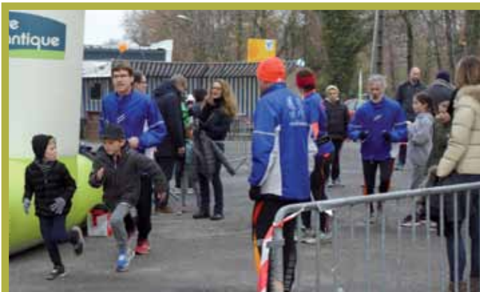
3 décembre. Les animations du Téléthon ont permis de récolter près de 7000€.