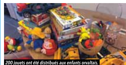
200 jouets ont été distribués aux enfants orvaltais.

En décembre dernier, le Cabinet Î a participé à l'opération « un jouet = un enfant heureux », en partenariat avec l'association « L'Espoir Orvaltais ». Grâce à la générosité des habitants et commerçants locaux, 2 m 3 de jouets ont été collectés, soit plus de 200 jouets remis aux enfants issus de familles défavorisées le jour de Noël. L'équipe de Cabinet Î remercie l'ensemble des personnes s'étant mobilisées pour la 2 e édition de cette action solidaire.