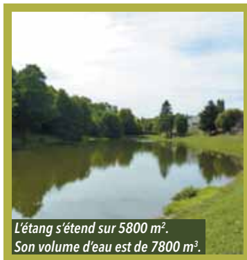
L'étang s'étend sur 5800 m 2 . Son volume d'eau est de 7800 m 3 .

L'étang du Choizeau, situé en plein bourg de Vigneux, est un site paisible et remarquable pour tous les amoureux de la nature. En 2017, différents travaux vont avoir lieu pour préserver et valoriser cet espace naturel.