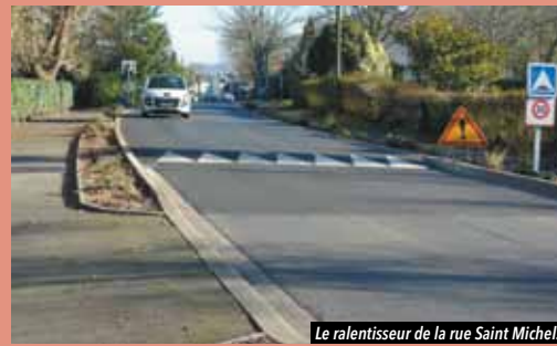
Le ralentisseur de la rue Saint Michel.

Il permet de réduire la vitesse de conduite et d'améliorer la sécurité des automobilistes. Ce ralentisseur vient remplacer l'ancienne chicane installée en 2013 et devenue trop dangereuse.