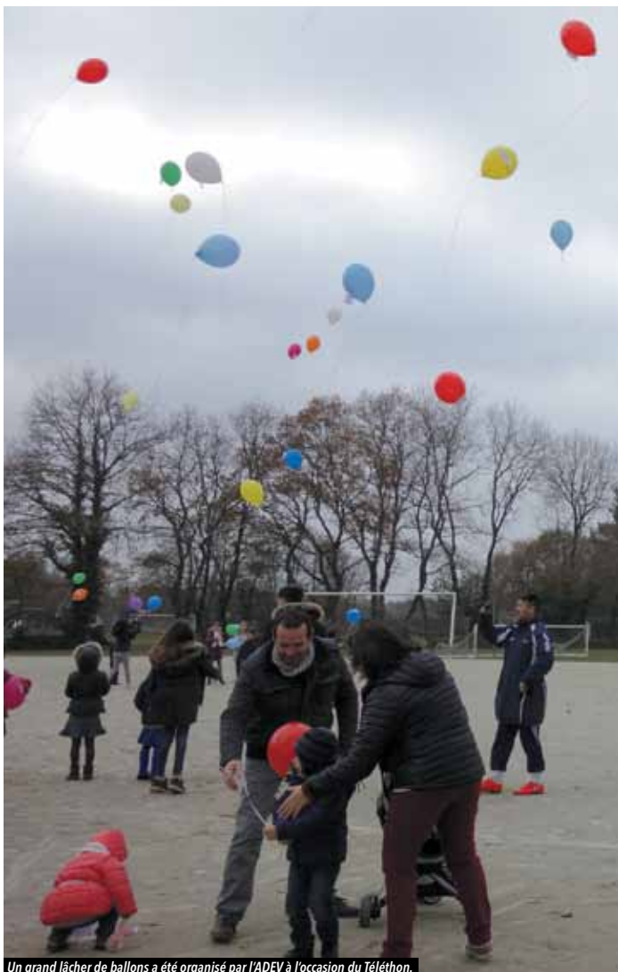
Un grand lâcher de ballons a été organisé par l'ADEV à l'occasion du Téléthon.

Le Téléthon 2016 a eu lieu samedi 3 décembre. Pour la première fois, les animations se déroulaient dans les deux bourgs de la commune. Cette mobilisation a permis de récolter plus de 6 700 € de fonds.