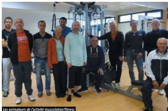
Les animateurs de l'activité musculation/fitness