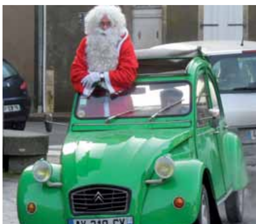
24 décembre. En 2CV décapotable, le Père Noël a apporté des cadeaux aux utilisateurs-trices du minibus.