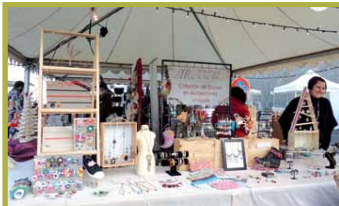
17 décembre. Un public nombreux est venu flâner au marché de Noël et profiter des animations.