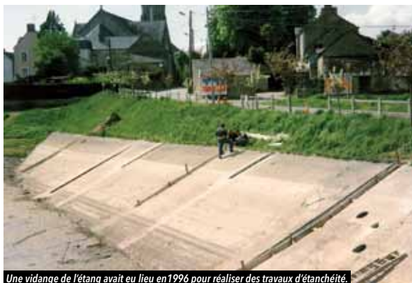
Une vidange de l'étang avait eu lieu en 1996 pour réaliser des travaux d'étanchéité.

en 1988. 1280 m 3 de sédiments sableux et limoneux seront extraits lors de cette opération. Les poissons seront prélevés par la Fédération Départementale de Pêche afin de récupérer les poissons présents et assurer la gestion piscicole future de l'étang. La pêche sera donc impossible durant plusieurs mois.