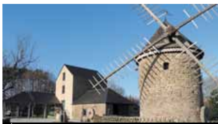
L'Écomusée comprend deux sites : le Moulin Neuf et la ferme de La Paquelais.