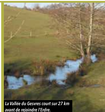
La Vallée du Gesvres court sur 27 km avant de rejoindre l'Erdre.