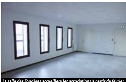
La salle des Fougères accueillera les associations à partir de février.

Les travaux de réhabilitation des locaux du complexe sportif viennent de s'achever. Les associations pourront bientôt bénéficier de nouveaux espaces de réunion et de rangement.