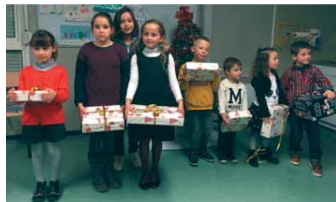
10 décembre. Les 8 gagnants du concours de dessins organisé par l'ACAVP.