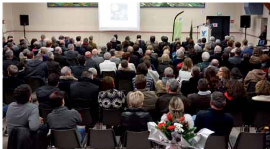
13 janvier. Les vœux du maire à la population ont réuni près de 200 personnes.