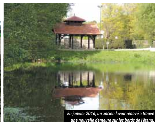
En janvier 2016, un ancien lavoir rénové a trouvé une nouvelle demeure sur les bords de l'étang.