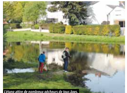
L'étang attire de nombreux pêcheurs de tous âges.

L'étang du Choizeau a été mis en eau en 1967. Avant, l'espace était couvert de jardins potagers. Le ruisseau du Choizeau traversait ces jardins et venait notamment alimenter un lavoir situé près des actuels ateliers municipaux, avant de poursuivre sa course jusqu'au Gesvres. C'est en aménageant la route d'entrée du bourg que Nicole Hersart de la Villemarqué, maire, a eu l'idée de construire un barrage, et d'établir un étang.