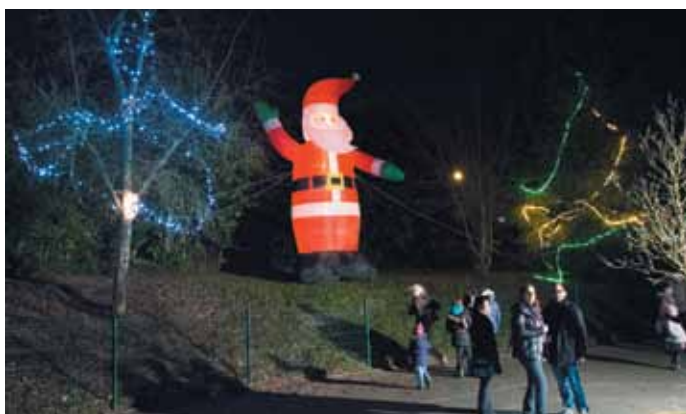
9 décembre. L'arbre de Noël de l'école Sainte Anne, sous le regard attentif d'un Père Noël de 6 mètres de haut.