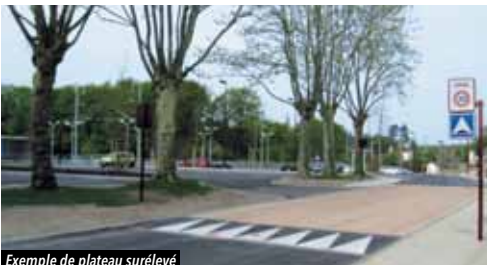
Exemple de plateau surélevé

D es travaux vont avoir lieu rue Saint Michel afin d'améliorer la sécurité des automobilistes. La chicane, créée lors de la construction de la Résidence de La Violette en 2013, pose des problèmes de sécurité. Afin d'y remédier, des travaux vont avoir lieu d'ici la fin de l'année : elle sera supprimée pour laisser place à un plateau surélevé.