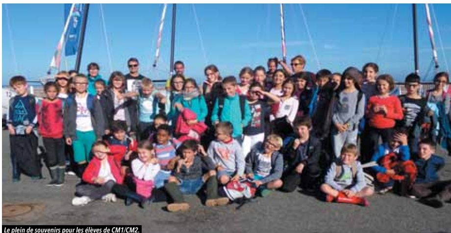
Le plein de souvenirs pour les élèves de CM1/CM2.

• Renseignements : centredeloisirsvigneux.blogspot.fr - www.vigneuxdebretagne.fr