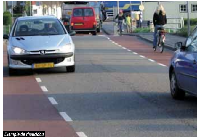
Exemple de chaudidou