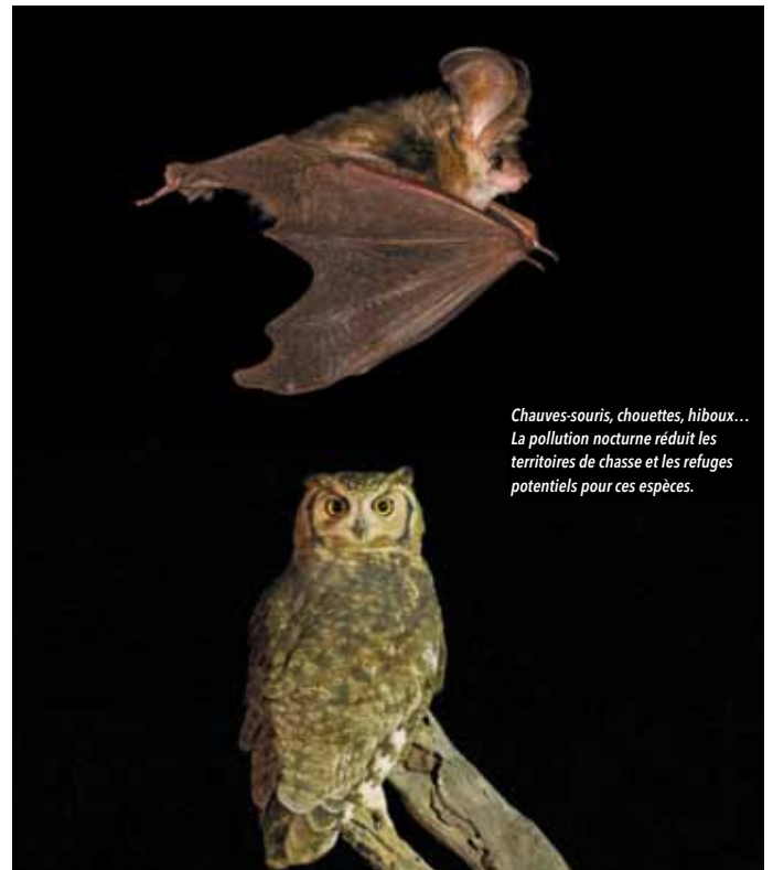
Chauves-souris, chouettes, hiboux... La pollution nocturne réduit les territoires de chasse et les refuges potentiels pour ces espèces.

En un siècle et demi, on a constaté des dégradations dans l'observation des comètes et du ciel étoilé. Avec une visibilité du ciel qui diminue fortement depuis les années 1980, les étoiles pourraient disparaître totalement du ciel des grandes villes à l'avenir.