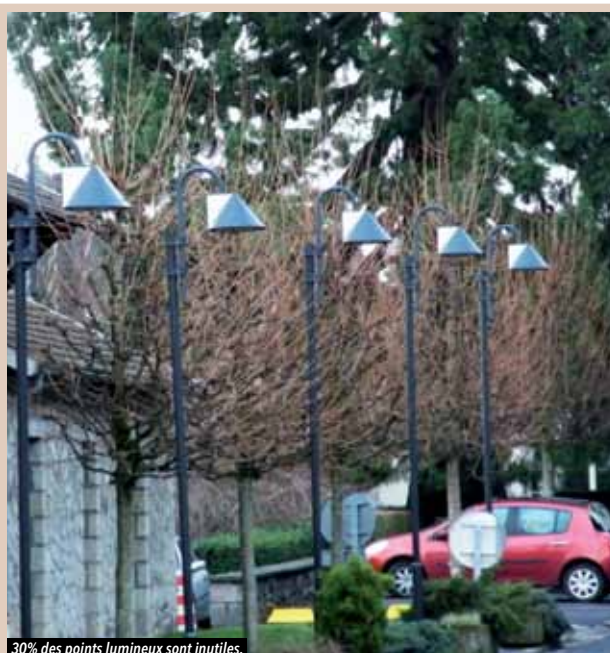
30% des points lumineux sont inutilisés.

du budget des consommations énergétiques des communes sont dédiés à l'éclairage public.