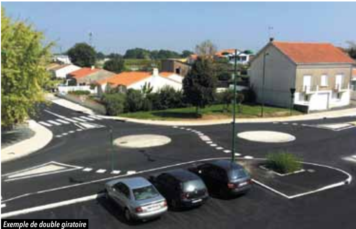
Exemple de double giratoire

Les travaux d'enfouissement des réseaux vont débuter fin novembre et les travaux de voirie en janvier, pour une durée d'environ six mois .