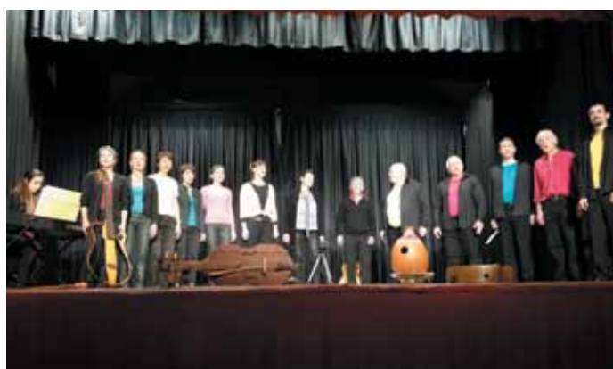
7 octobre. Concert de la chorale Babel Canto à la salle Le Rayon