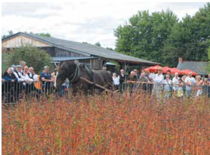
11 septembre. Fête du blé noir à l'Écomusée.