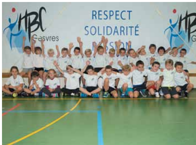
17 septembre. Cérémonie de remise des maillots du HBC Gesvres (handball).