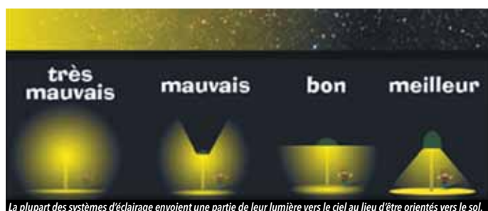
La plupart des systèmes d'éclairage envoient une partie de leur lumière vers le ciel au lieu d'être orientés vers le sol.