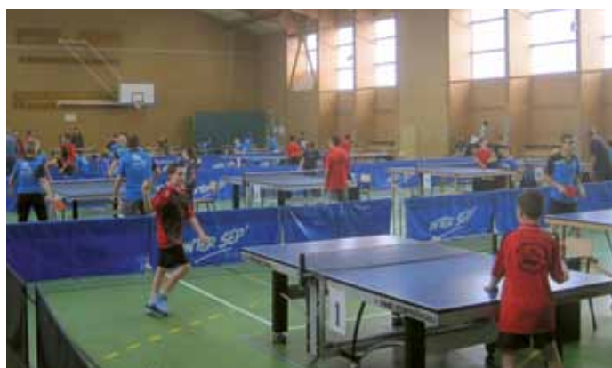
9 octobre. Pas loin de 80 pongistes (de 7 à 77 ans) au complexe sportif pour la compétition Ufolep de tennis de table « Le Challenge JB Daviais ».