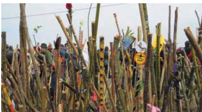
8 octobre. La mobilisation a réuni entre 12 000 et 40 000 personnes sur les terres de Notre-Dame-des-Landes. Les bâtons ont résonné sur les chemins de la ZAD avant d'être plantés dans un talus.