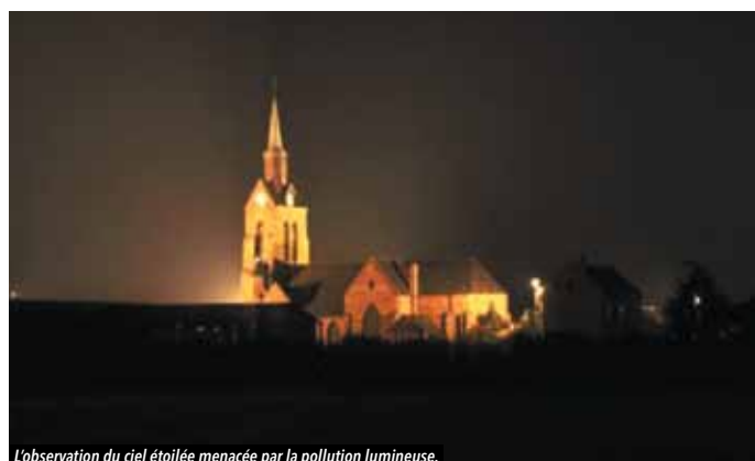
L'observation du ciel étoilé menacée par la pollution lumineuse.