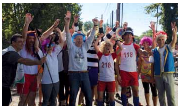
2 octobre. La 20 e édition du trail des 2 clochers a accueilli près de 350 participants déchaînés.