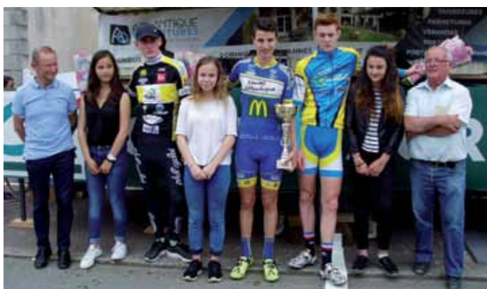
5 juin. Remise de trophées pour les courses cyclistes minimes et cadets organisées par le Cercle Vignolais Cycliste (en photo les cadets).