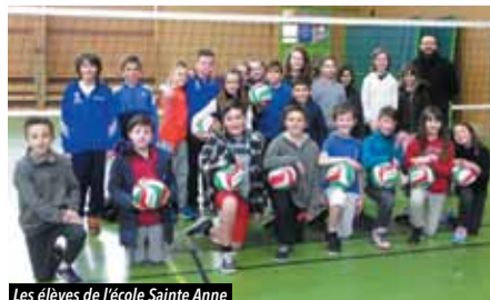
Les élèves de l'école Sainte Anne

• Contact : vigneux.volley.44@gmail.com et sur facebook