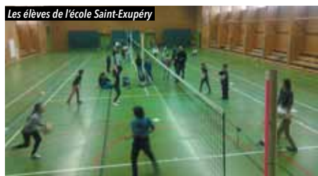
Les élèves de l'école Saint-Exupéry

Depuis plusieurs années déjà, Vigneux Volley propose une initiation aux jeunes CM1 ou CM2 de notre commune : l'opération Smashy.