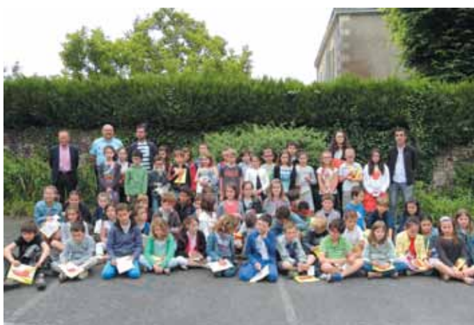
10 juin. Remise des permis piétons aux élèves de CE2 des trois écoles.