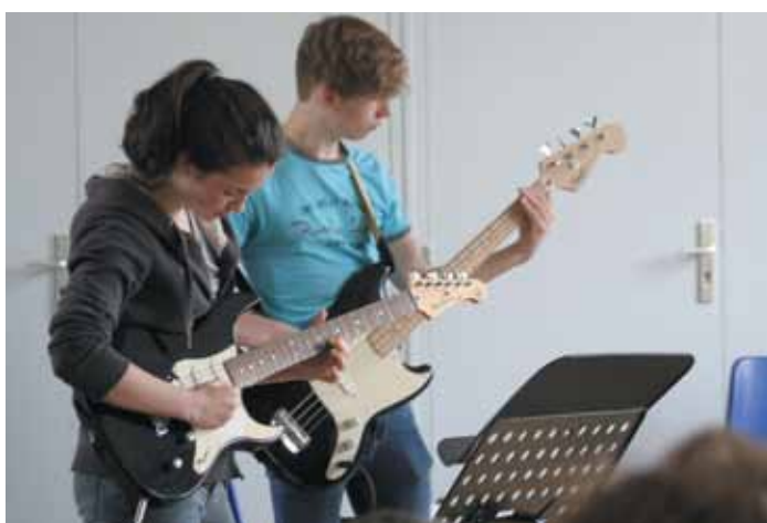
4 juin. Auditions des élèves de l'école de musique Arpège.