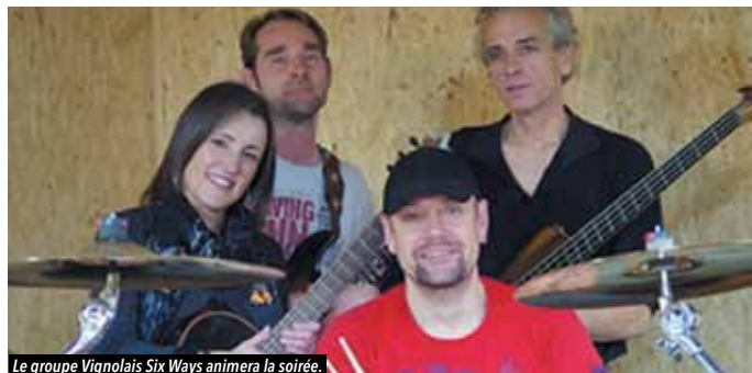
Le groupe Vignolais Six Ways animera la soirée.