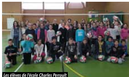
Les élèves de l'école Charles Perrault