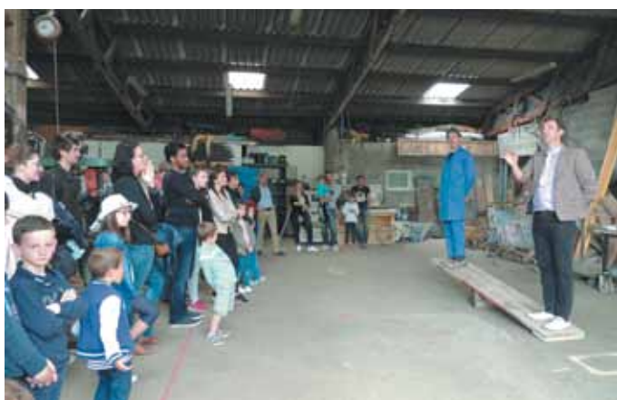
4 juin. Visite des ateliers de la compagnie Paris-Bénarès à Puceul.