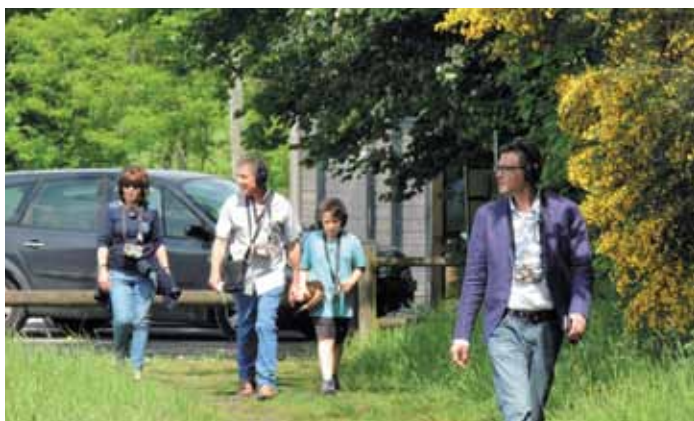
21 et 22 mai. Représentations du spectacle « Es-tu là ? » de la compagnie Entre chien et loup.