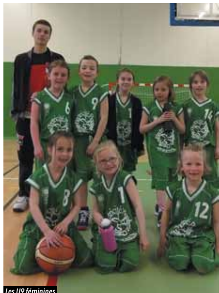
Les U9 féminines

La saison s'est achevée, les tournois ont été écumés. Nous allons devoir nous séparer le temps d'un été, pour mieux se retrouver à la rentrée.