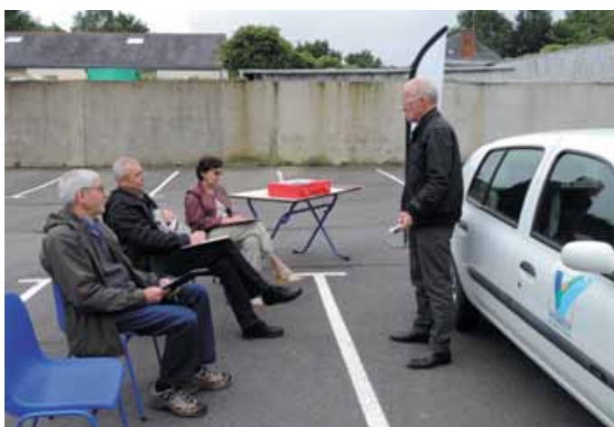
3 juin. Atelier prévention routière à destination des seniors.