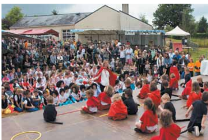
11 juin. Kermesse de l'école Sainte Anne.