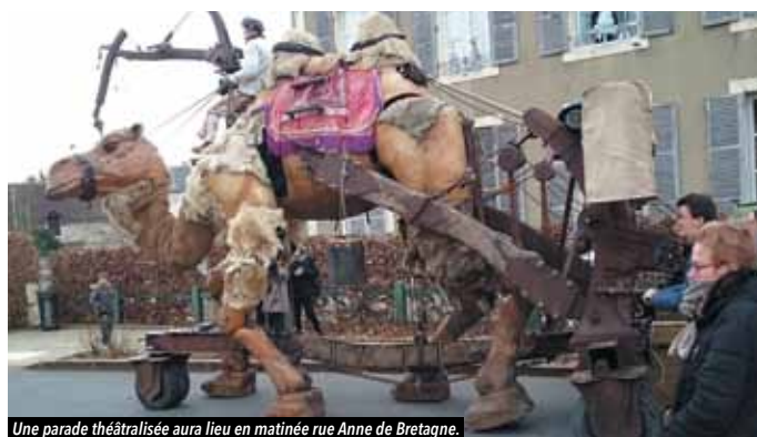
Une parade théâtralisée aura lieu en matinée rue Anne de Bretagne.