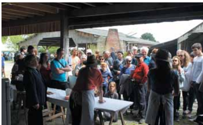
8 mai. Atelier fabrication du beurre au ribot à l'occasion de la Fête du printemps et des labours à l'Écomusée.