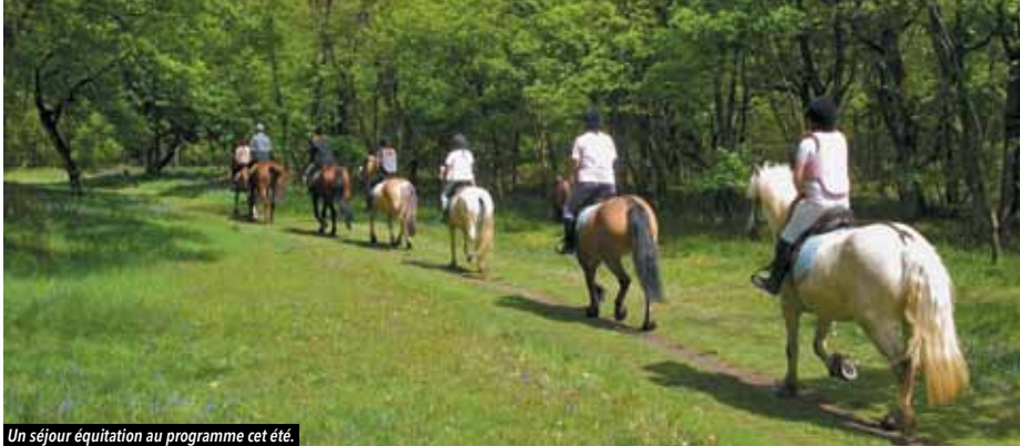
Un séjour équitation au programme cet été.

Le programme du S.A.V. vient de sortir ! Sorties estivales, animations sportives, activités créatives, séjours, Caravane Tour, soirées Paill'hot... de quoi bien occuper l'été des jeunes de 11 à 17 ans !