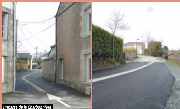
Impasse de la Charbonnière.