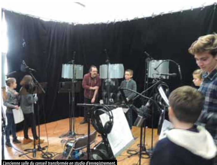
L'ancienne salle du conseil transformée en studio d'enregistrement.