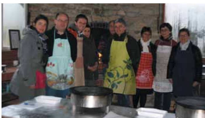
25 janvier. Stage de fabrication de galette traditionnelle au billig.