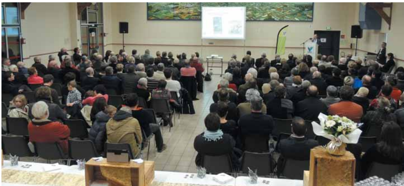
15 janvier. Vœux du Maire à la population.