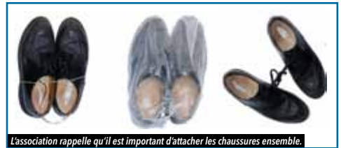
L'association rappelle qu'il est important d'attacher les chaussures ensemble.

Les chaussures usagées, mais propres et portables , sont collectées puis revendues sur le site du Relais Atlantique, entreprise de réinsertion du groupe Emmaüs. Les fonds récoltés permettent d'offrir à une trentaine d'enfants atteints de cancer et soignés aux CHU de Nantes et