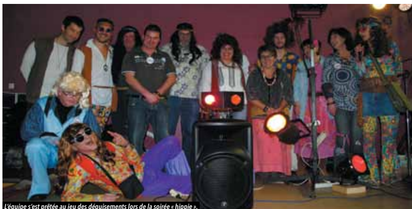
L'équipe s'est prêtée au jeu des déguisements lors de la soirée « hippie ».

L'association des Commerçants et Artisans du village de La Paquelais (ACAVP) tient à remercier chaleureusement tous les Paquelaisiens et Vignolais pour leur participation au concours de dessin et la soirée « hippie » du 30 janvier.