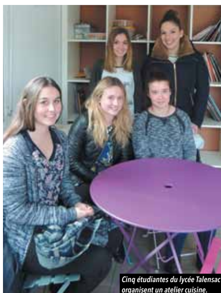
Cinq étudiantes du lycée Talensac organisent un atelier cuisine.

Nous souhaitons travailler autour de l'orientation professionnelle des jeunes au collège, qui s'avère parfois difficile.