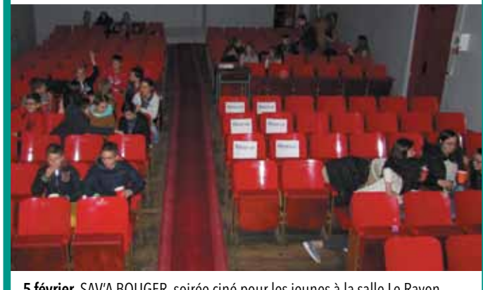
5 février. SAV'A BOUGER, soirée ciné pour les jeunes à la salle Le Rayon.