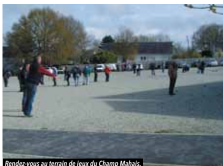
Rendez-vous au terrain de jeux du Champ Mahais.

Venez nombreux passer un agréable après-midi.