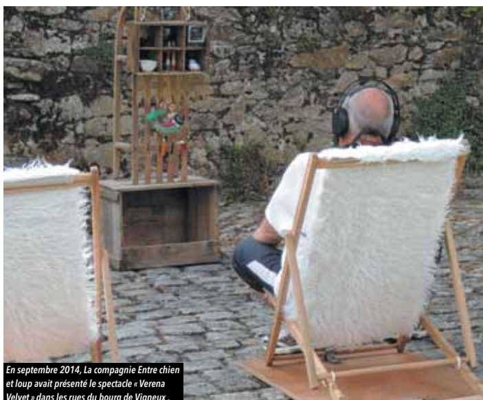
En septembre 2014, La compagnie Entre chien et loup avait présenté le spectacle « Verena Velvet » dans les rues du bourg de Vigneux.

Ouvert à tous sans inscription. RDV à l'ancienne salle du conseil.