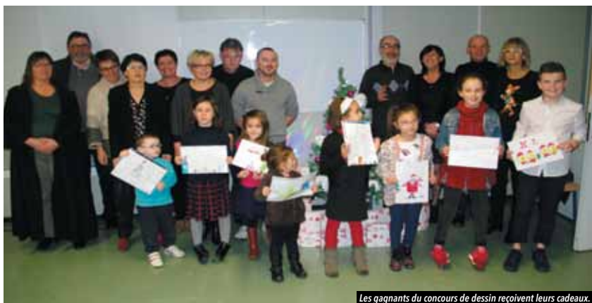
Les gagnants du concours de dessin reçoivent leurs cadeaux.

Nous vous donnons rendez-vous fin mai pour une distribution de roses, à l'occasion de la fête des mères, chez vos commerçants de La Paquelais.