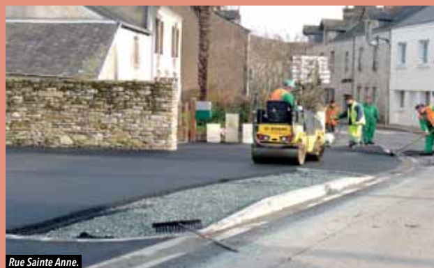
Rue Sainte Anne.

Différentes interventions ont eu lieu sur la voirie ces dernières semaines, avec notamment des poses d'enrobé impasse de la Charbonnière, rue Sainte Anne, parking du Rayon et parking de la Fontaine Saint-Martin.