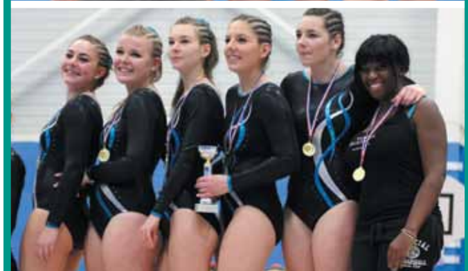
23 et 24 janvier. Palmarès des départementaux de gymnastique à Bouaye.