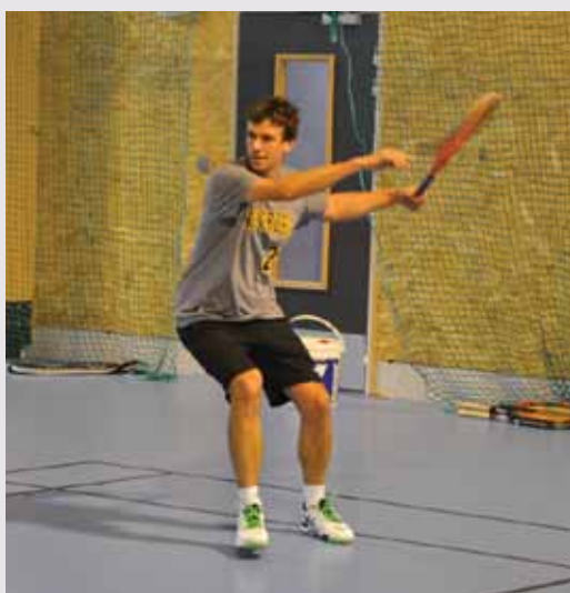
Investissement global de la mairie pour ces équipements (comprenant la piste athlétique) :