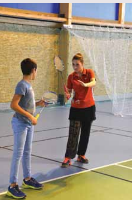
Tennis, badminton, tennis de table : la halle de raquettes n'a pas désempli de la journée.