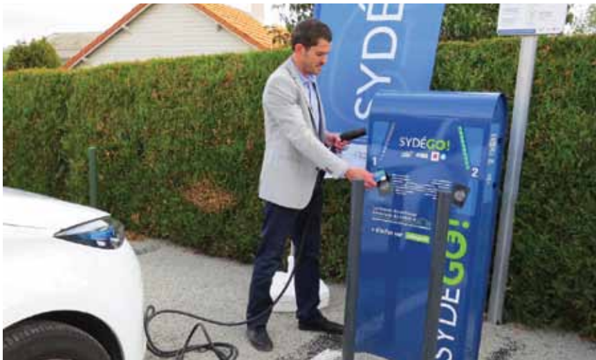
Les bornes de recharge pour véhicules électriques.