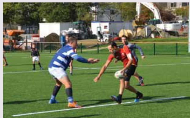
Démonstration de touch rugby associant la mixité et les générations de tous âges sur le terrain de grands jeux rugby utilisé par l'association Stade Treillierain, les écoles et le collège.