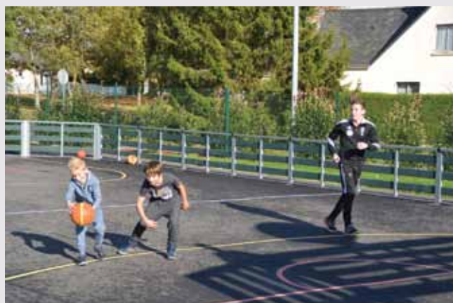
Animations basket sur le terrain multisports

2 800 adhérents, 53% d'entre eux ont moins de 18 ans.