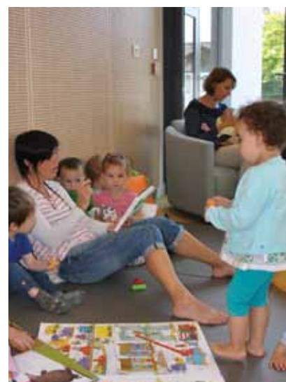
le Groupe George V Atlantique, nécessaire à la réalisation de ce projet.

est en cours en cœur de bourg au niveau des terrains de sport et porte sur une offre d'habitat mixte, sur l'implantation d'une résidence service senior, sur une surface commerciale et des cellules commerciales, et sur la construction d'une médiathèque. Les membres du Conseil municipal, à la majorité de 22 voix pour et 6 voix contre, ont voté la signature du protocole d'accord avec Métay Immobilier et la signature du protocole d'accord avec