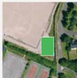
PLATEAU MULTISPORTS 12x25 [football, volley, tennis, basket]