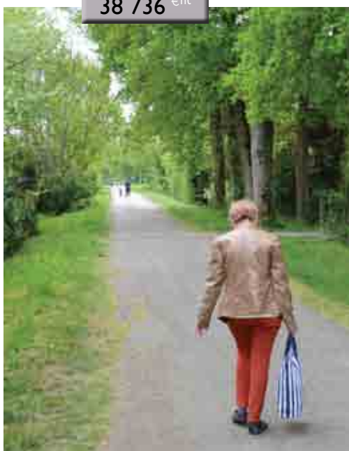
Le chemin de la Sablonnais bientôt éclairé.