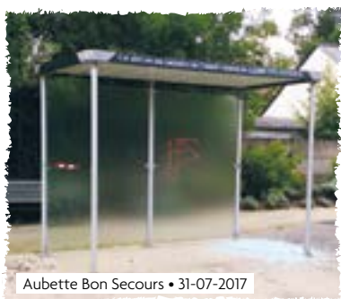
Aubette Bon Secours • 31-07-2017

Quarante faits sont reconnus par la police municipale depuis le 1 er janvier 2017. C'est insupportable et inacceptable.