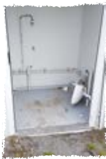
Toilettes square enfants de la Planchette

Une réunion publique sera organisée prochainement au cours de laquelle, chaque citoyen pourra s'exprimer sur le sujet.