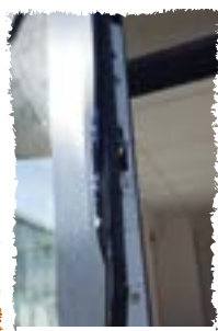
Porte d'entrée de la salle des Frénoelles