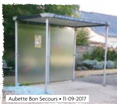
Aubette Bon Secours • 11-09-2017