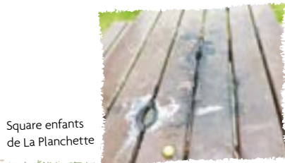
Square enfants de La Planchette