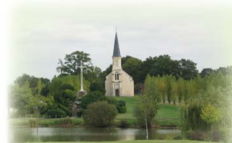
L'étang et la Chapelle Madeleine

A gauche, emprunter le "Chemin des Morts". A la rue du Petit Bal, prendre à droite et, au stop, prendre en face la rue du Lavoir. Au rond-point, prendre à gauche puis à droite devant la mairie. Longer le complexe Espace Madeleine jusqu'au parking des étangs.