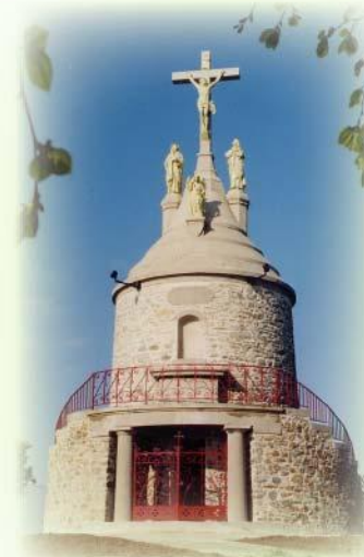
Le Mont Juillet

Passer devant le village de la "Foutinière" puis celui de la "Michetière" pour arriver au village du "Bois Souchard". A la route, prendre à droite, puis à gauche pour contourner le complexe polyvalent et rejoindre ainsi le point de départ.